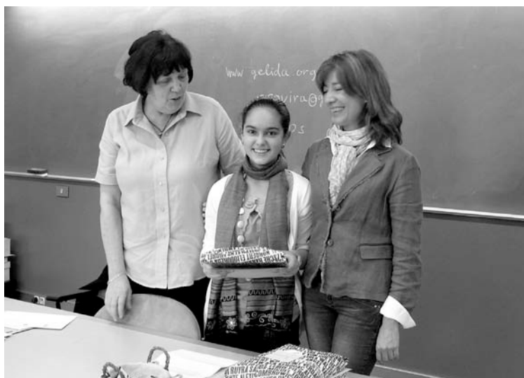
ENTREGA DEL PREMI DE LA CATEGORIA INFANTIL